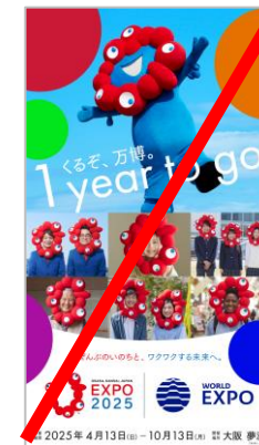
他の要素と組み合わせる