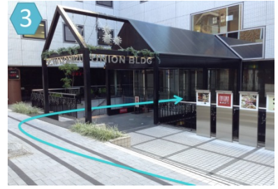
(3) 三角屋根の入り口から入りエレベーターで4階エムワイ貸会議室にお越し下さい。