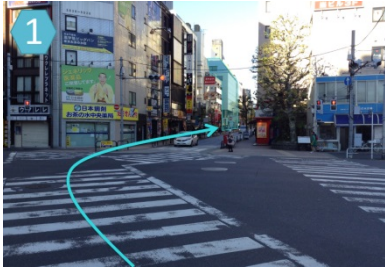
(1) JR 御茶ノ水駅 御茶ノ水橋口を出られましたら、目の前にあるスクランブル交差点を対角側に渡り、右へお進み下さい。