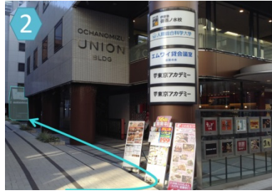
(2) 大きな円柱があるビル(お茶の水ユニオンビル)までこられましたら左の路地に入りお進み下さい。