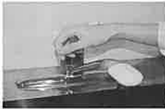
7. 水道の栓を止めるときは、手首が肘で止める。できないときは、ペーパータオルを使用して止める