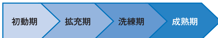
図表-7 事業のプロセス

事業の立ち上げは「初動期」であり、その後取組を広く充実させていくための「拡充期」、取組の質をさらに向上させる「洗練期」、内容を深め成熟させていく「成熟期」となります。