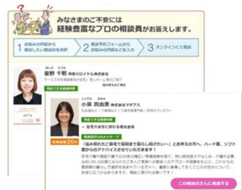
お悩みの内容に沿って相談員を選択

皆さまの住民等向け相談窓口において、高齢期の住まい方に関する相談があった場合には、上記HP（総合相談サービス）のご紹介をお願いします。