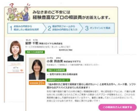
お悩みの内容に沿って相談員を選択

皆さまの住民等向け相談窓口において、高齢期の住まい方に関する相談があった場合には、上記HP（総合相談サービス）のご紹介をお願いします。